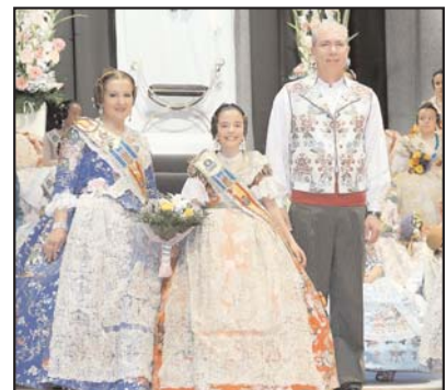
Falla Santa Bàrbara