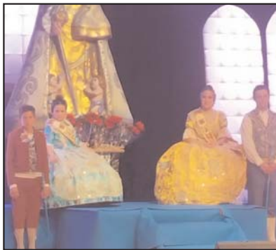
Falla Sant Josep

Les comissions falleres presenten als seus màxims representants 2016