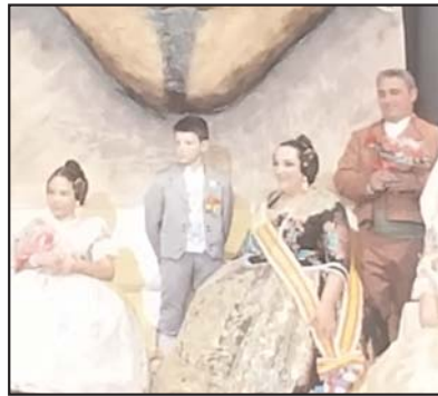
Falla La Verge