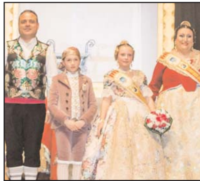
Falla Mitja Capa